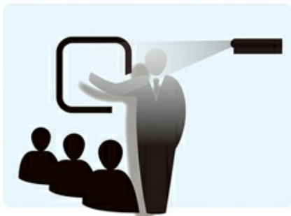
No Image Shadows