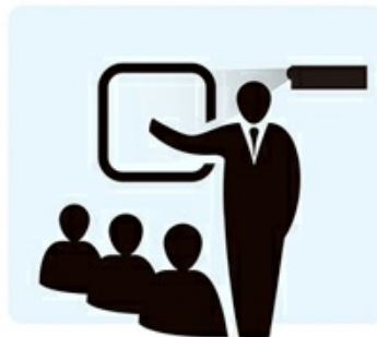
No Projection Beam