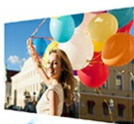
SuperColor™ projectors offer color accuracy levels