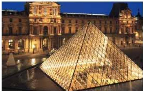
Dynamic Contrast Ratio

За дополнительной информацией по продуктам, пожалуйста, посетите наш сайт: www.viewsoniceurope.com