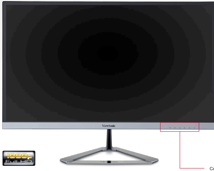
Controles de menú