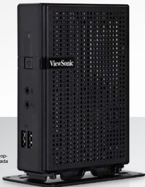
Se muestra sin opción WiFi integrada