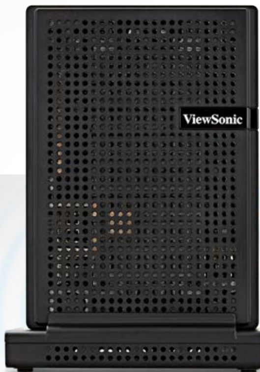
Se muestra con opción WiFi integrada