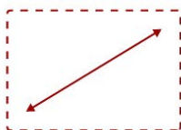
Pantalla DE 32"