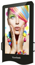
Full HD Resolution